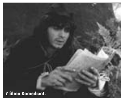
Z filmu Komediant.