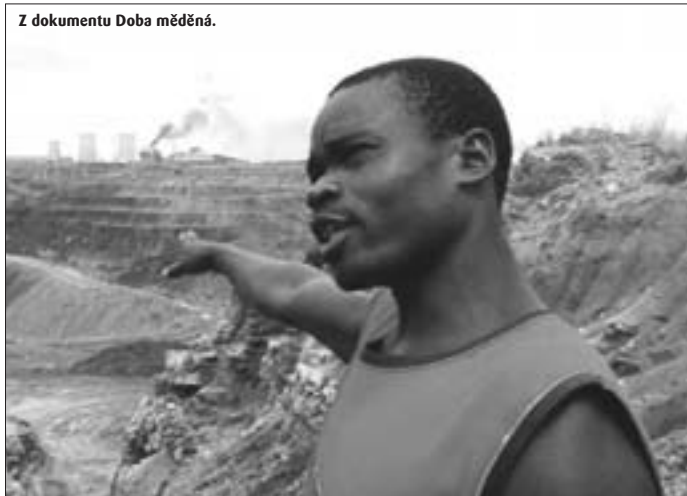
Z dokumentu Doba měděná.