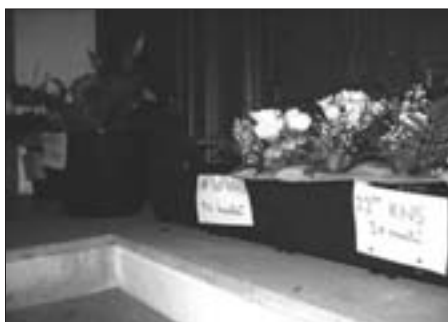
Květiny v Městanské besedě trpělivě čekají na své nové majitele.

Gustav Machatý (režisér, nedožitých 110 let): Extase (1932)