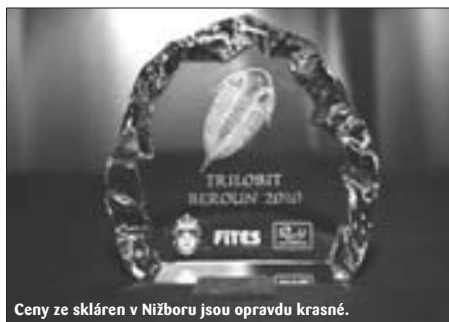
Ceny ze sklárny v Nižboru jsou opravdu krásné.