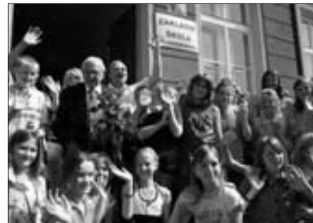
N. W. s českými dětmi.

Snímek Nickyho rodina by jeho tvůrci chtěli přes Dis-