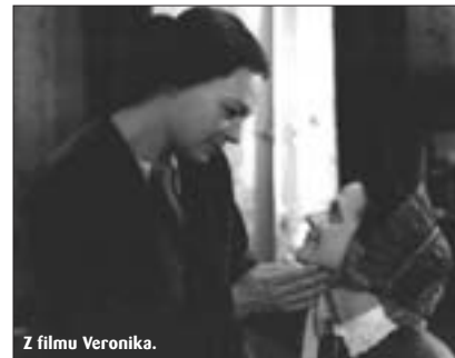
Z filmu Veronika.