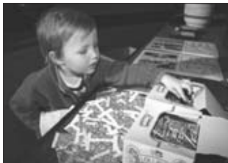
Dárky získali jak ti menší...