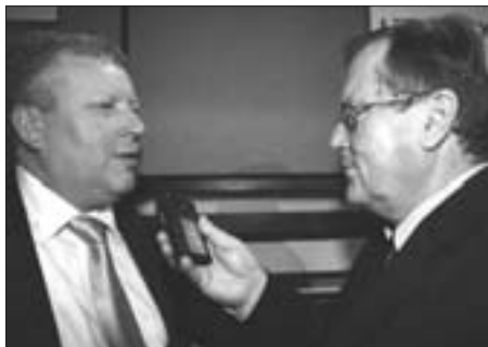
Ministr kultury Jiří Besser v rozhovoru pro Český rozhlas 3 - stanici Vltava (s moderátorem večera Josefem Vomáčkou).