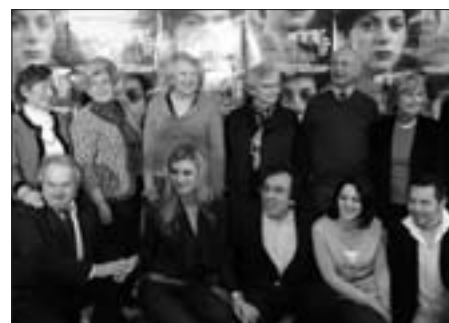
Tvůrci filmu a zachráněné děti.

Snímek Nickyho rodina obsahuje hrané vsuvky, i to