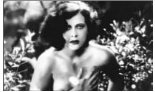
Z filmu Extase .

Na světě existuje jediný festival, který se systematicky věnuje českému filmu a nabízí možnost srovnávat současnou produkci s tím nejlepším, co se u nás natočilo v minulosti. Tím festivalem je Finále.