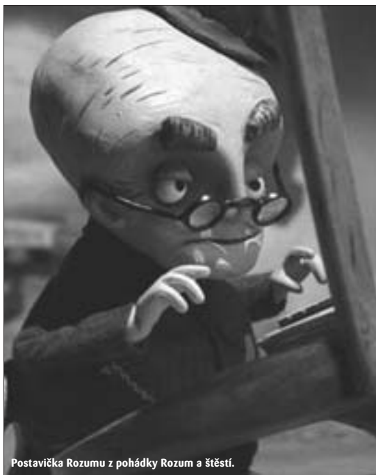
Postavička Rozumu z pohádky Rozum a štěstí.

v intencích pohádky pana Wericha, podle originálního výtvarného návrhu španělské výtvarnice Patricie Ortiz Martínez vznikla krásná loutka, jeden z hlavních protagonistů celé pohádky. A pak už se jen tvůrci domluvili na spolupráci s největším českým aukčním portálem AUKRO.CZ tak, aby se Štěstí mohlo vydražit v týdnu slavnostní premiéry, a aby celý výtěžek aukce šel přímo na konto CENTRA PARAPLE.