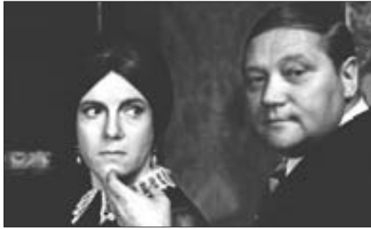
Vlasta Chramostová a Rudolf Hrušínský ve filmu Spalovač mrtvol .