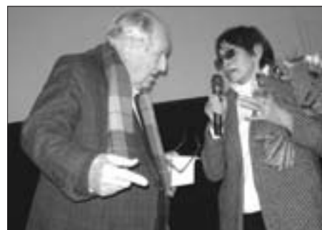
Věra Chytilová a Jiří Krejčík na Finále 2009.