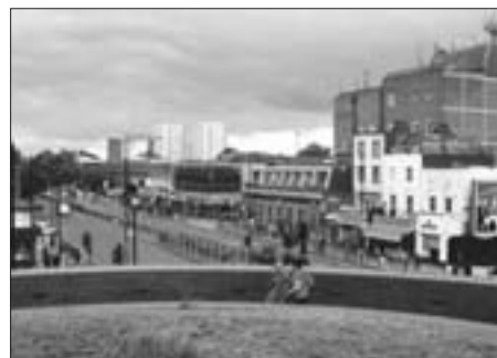
Snímek z právě natáčeného filmu Mike Leigha na sportovní téma.