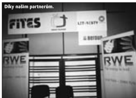
Díky našim partnerům.