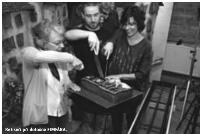
Režisérí při dotočné FIMFÁRU.

10. února vstoupil do kin další pozoruhodný snímek, v řadě už třetí animované Fimfárum Jana Wericha, tentokrát ovšem ve formátu 3D. Opět obsahuje tři pohádky a jejich hlavním průvodcem je opět Jan Werich – ostatně jeho podání je nedostižné. Vznikl tak snímek pro děti i dospělé, který se ctí navazuje na slavnou českou školu animovaných filmů a který si jistě najde cestu i do ciziny.