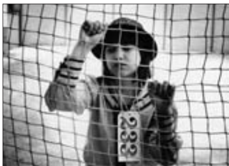
Záběr z filmu Nickyho rodina.

Premiéra proběhla nadvakrát ve zcela zaplněném Kongresovém centru v Praze a byla opravdu slavnostní. Norský velvyslanec v naší zemi převzal oficiální českou nominaci Sira Nicholase Wintona na Nobelovu cenu míru, petici s tímto návrhem podepsalo přes sto tisíc dětí a mladých lidí z celé zeměkoule. Promluvili představitelé různých humanitárních organizací, zástupci Základní školy Sira Nicholase Wintona v Kunžaku (Winton se s žáky školy nesoucí jeho jméno