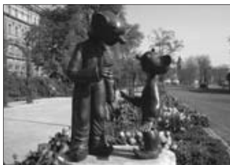
Plzeň – to jsou i Spejbl s Hurvínekem.