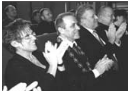
Ministr kultury, starosta Berouna a další vzácní hosté.