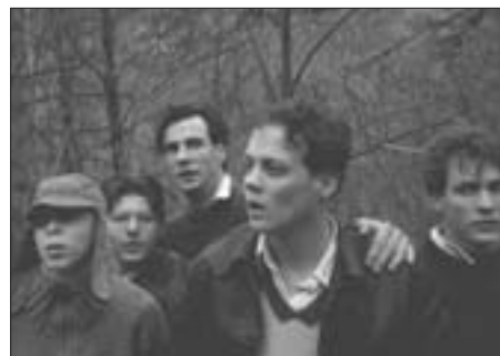
Fotografie z filmů uváděných v rámci festivalu MENE TEKEL.