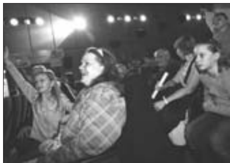
Atmosféra v kině Mír byla skvělá.