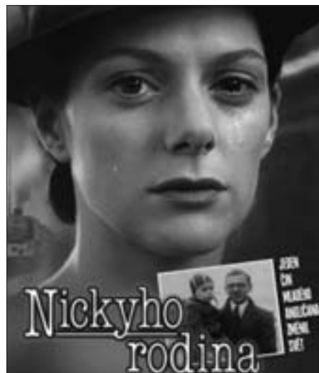
Plakát k filmu Nickyho rodina.

Paměti, tedy písemnosti a fotografie, které Wintonovy skutky zaznamenávají, ležely padesát let na půdě jeho domu. Napadá mě, že náhodné odhalení jeho manželky, poté pořad v BBC v roce 1989 a pak i zájem československých filmařů Siru Nicholasi Wintonovi dost „zkomplikovaly“ žití. Poklidný život se změnil v dostihy, přijetí u britské královny, amerického prezidenta, dalších a dalších významných osobností, cesty po světě, řády a medaile, besedy,