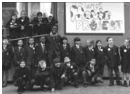
Skupina školáků, jež se účastní projektu Tate Gallery – návrhu na film pro kulturní olympiádu.