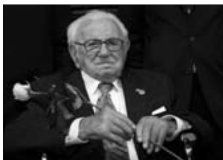
Nicholas Winton během premiéry.

U dlouholetého filmového příběhu je i Patrik Pašš. „V roce 2003 jsme se s panem Wintonem v Anglii zúčastnili jedné besedy po projekci filmu; děti s ním vedly dialog. Ptaly se: co my můžeme udělat, jak pomoci světu kolem, co udělat, abychom se s našimi rodiči nedostali do takové situace, v jaké byli rodiče s dětmi v Československu v roce 1939? Sir Winton odpověděl: stačí málo, vystoupit ze své ulity a udělat