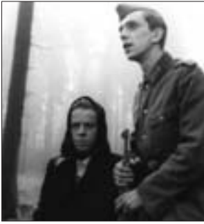
Iva Janžurová a Jaromír Hanzlík ve filmu Kočár do Vídně .