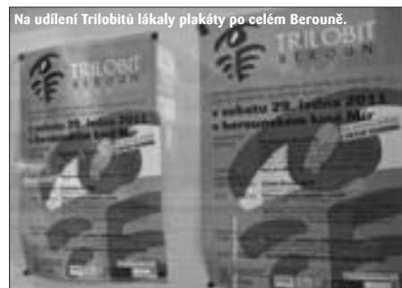
Na udílení Trilobitů lákaly plakáty po celém Berouně.

Ministr kultury to sice (asi) řekl s mírně humornou nadsázkou, ale kdoví, třeba to bude perspektivně pravda: Ceny Trilobit se v budoucnu stanou konkurencí pro České lvy, a možná i pro karlovarský filmový festival. Jiří Besser přijel 29. ledna 2011 na slavnostní udílení výročních cen TRILOBIT, udělovaných za původní filmovou a televizní tvorbu do Berouna téměř jako domů – vždyť tu šestnáct let starostoval. A tak si mohl pochvalovat nejen „trilobiti“ večer, kde ani v minulých letech nechyběl, ale užívat si i areálu pěkně rekonstruovaného kina. Ve svém vystoupení se zmínil i o dlouho připravovaném a očekávaném zákoně o kinematografii, jehož schválení je – doufejme – konečně už na spadnutí. Na vylepšené kino právem upozornil i současný starosta Tomáš Havel. A připomněl, že město Beroun dostalo titul Historické město roku, čímž byla