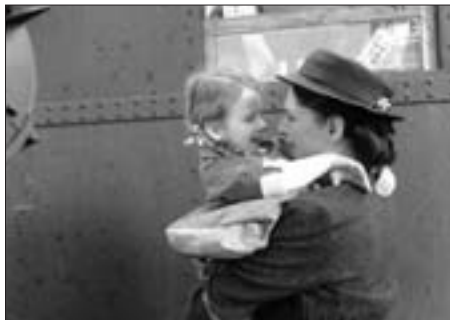
Klára Issová ve filmu Nickyho rodina .