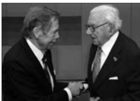
Nicholas Winton a Vaclav Havel.