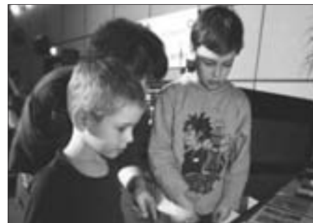
... tak i ti větší.