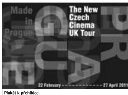
Plakát k přehlídce.

Přehlídka Made in Prague 2011 bude slavnostně zahájena 22. února na Mezinárodním filmovém festivalu