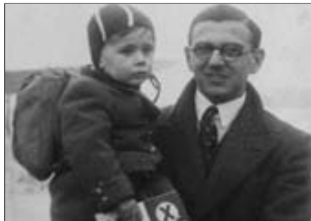
Nicholas Winton „zamlada“ s jedním ze zachráněných dětí.

Třetí snímek na wintonovské téma už přitom dělat nechtěl, měl pocit, že dluh vůči zachránci několika set československých židovských dětí splatil. „Svolil jsem s tím, že tento film bude mít určité přesahy,“ dodává. Oba dva předchozí snímky a tak i činy Sira Nicholae Wintona se totiž setkaly s neuvěřitelnou lavinou ohlasů z celého světa. „Stalo se něco nepochopitelného: snímek Síla lidskosti ve všech světadílech shlédlo tři a půl miliónu dětí, které nám začaly psát – co to s nimi udělalo, jak pomáhají bližním i neznámým. Tyto přesahy jsem tedy chtěl do svého filmu dostat,“ říká režisér. Navíc: Winton se stal celebritou, přijímají ho hlavy