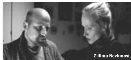
Z filmu Nevinnost.