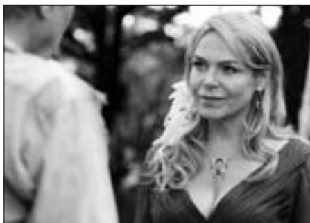
Dagmar Havlová v roli kancléřovy přítelkyně