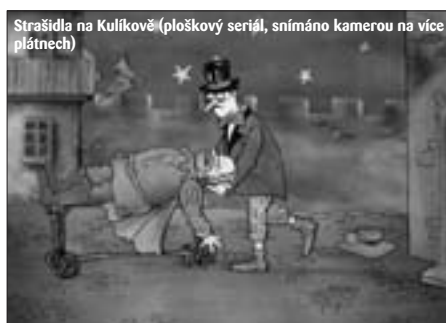
Strašidla na Kulíkově (ploškový seriál, snímáno kamerou na více plátcích)