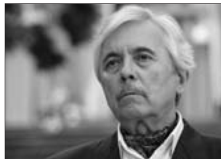
Josef Abrhám v hlavní roli