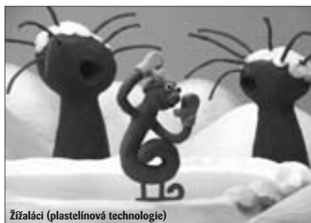
Žížaláci (plastelinová technologie)