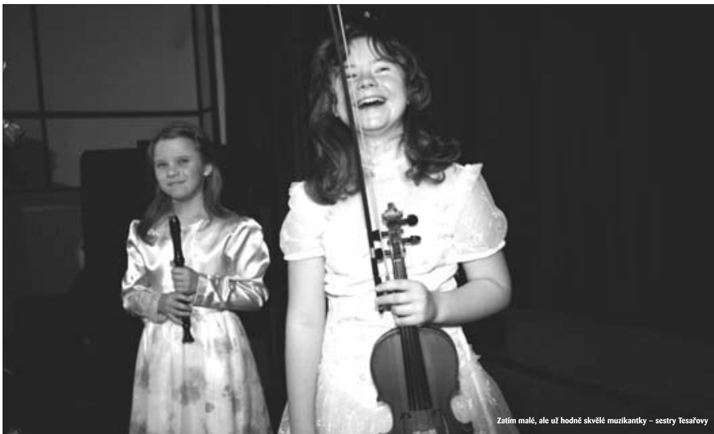
Zatím malé, ale už hodně skvělé muzikantky – sestry Tesařovy