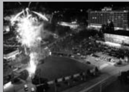
Na shledanou na ZFF 2011!

a produktivního věku. Jsme si vědomi, že tuto cílovou skupinu netvoří jen studenti a filmoví fanoušci, ale též budoucí rodiče! Právě na jejich cítění, vkusu, vzdělanosti a morálních vlastnostech se bude formovat stav společnosti nejen české a evropské! Zejména míra dobré vůle, tolerance a porozumění u mladých lidí napříč světem výrazně ovlivní atmosféru XXI. století.“