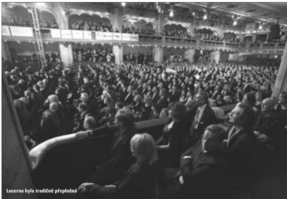
Lucerna byla tradičně přeplněná