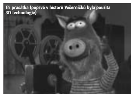
Tři prasátka (poprvé v historii Večerníčků byla použita 3D technologie)