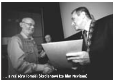
... a režiséru Tomáši Škrdlantovi (za film Nevítaní )