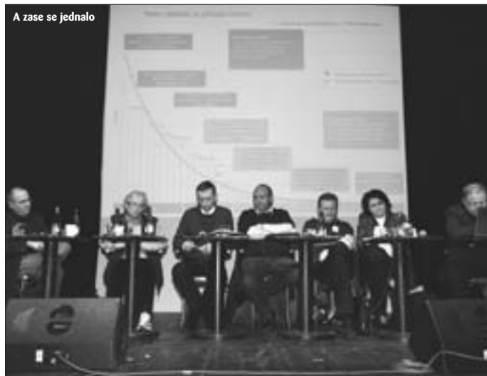
A zase se jednalo