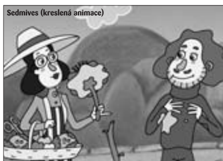
Sedmives (kreslená animace)