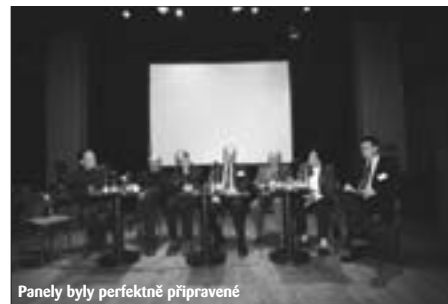
Panely byly perfektně připravené

věnoval obsahovým a organizačním formám veřejnoprávního vysílání v Německu i v dalších zemích Evropy.