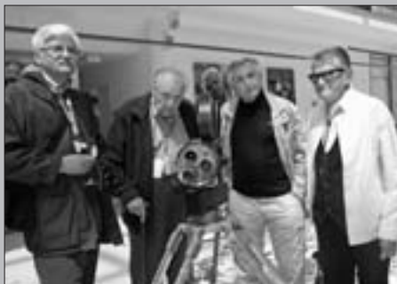
Dušan Hanák, Jiří Krejčík, Jiří Menzel a Vojtěch Jasný ve Zlíně