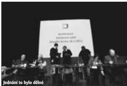
Jednání to bylo dělné

televizemi veřejné služby? Jaké jsou současné priority ČT v programové skladbě? Kritické hlasy o restrukturalizaci totiž tvrdí, že základní filozofií těchto změn je narušit stávající vazby dramaturgů s autory, že současné struktury nejsou jasné kompetence a vztahy oddělení vývoje programu a programových formátů s řediteli jednotlivých programových okruhů (ČT1, ČT2), ale i vztahy s ostatním vrcholovým managementem, atd.