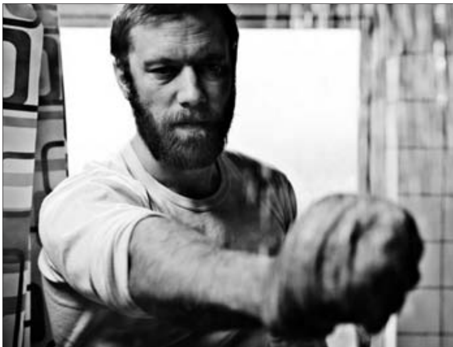
Z filmu Thomase Winterberga Submarino