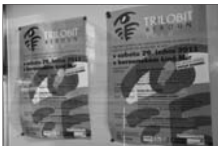
Plakáty lákaly k akci po celém Berouně

Ještě jednou se v tomto čísle ohlédneme za 29. lednem, dnem, který byl v Berouně spojen s cenami FITESu Trilobit. Trilobit a jeho berounský program jsou vlajkovými loděmi činnosti FITESu, proto nás těší příznivé ohlasy jak na Dopoledne s Večerničky, tak i na slavnostní večer s vyhlášením vítězů a projekcemi, které stále docházejí. Všechny zmíněné akce proběhly v kině Mír.