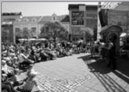
Den Českého rozhlasu