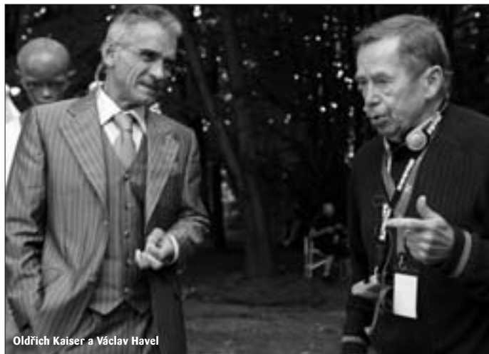
Oldřich Kaiser a Václav Havel