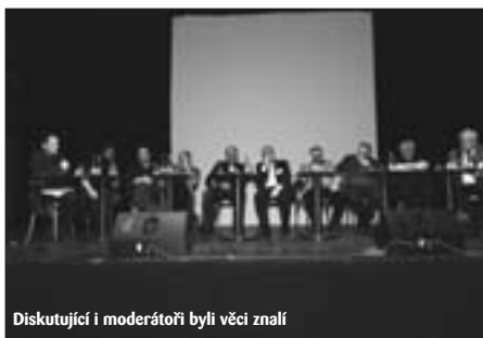
Diskutující i moderátoři byli věci znalí

Panel Veřejnoprávní televizní vysílání v zahraničí se