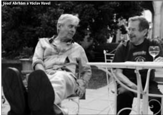
Josef Abrhám a Václav Havel

Zamýšlet se nad tím, zda Havel zpracoval konkrétní příběhy konkrétních osob, a podsouvat mu tím vyrovnávání si vlastních účtů mi připadá scestné. Pochopitelně, že každé dílo odráží osobní zkušenosti autora, které ovšem dobrý autor dokáže zobecnit a vytvořit z nich tzv. modelovou situaci. A v tom je Havel skutečný mistr. Odcházení přes modelové situace, pomocí groteskní stylizace, podává obraz o panoptikálním světě mocných, o to ostřejší, že autor sám byl jedním z nich. Při běhu filmu mi kdesi v paměti vytanula Havlova reakce, když se stal prezidentem Československé republiky. "Připadá mi to poněkud absurdní," prohlásil tehdy a jistě s nemalým pobavením a ironickým nadhledem sledoval, jak je jeho portrét ve školách vyměňován za portrét Husákův. Jak by nebyla jeho absurdní groteska o tyto zážitky obohacena. To, že dokázal vše zpracovat nadčasově, bez osobních a nízkých invektiv, jako absurdní podobenství, mu jenom slouží ke cti. A podsouvat mu jakoukoli prvoplánovost, je hloupé, i když vystihující úroveň „podsouvače“ (kdyby to bylo takhle jednoduché, tomu bychom rozuměli, ale obecně, v umělecké licenci, s tím si nevíme rady).