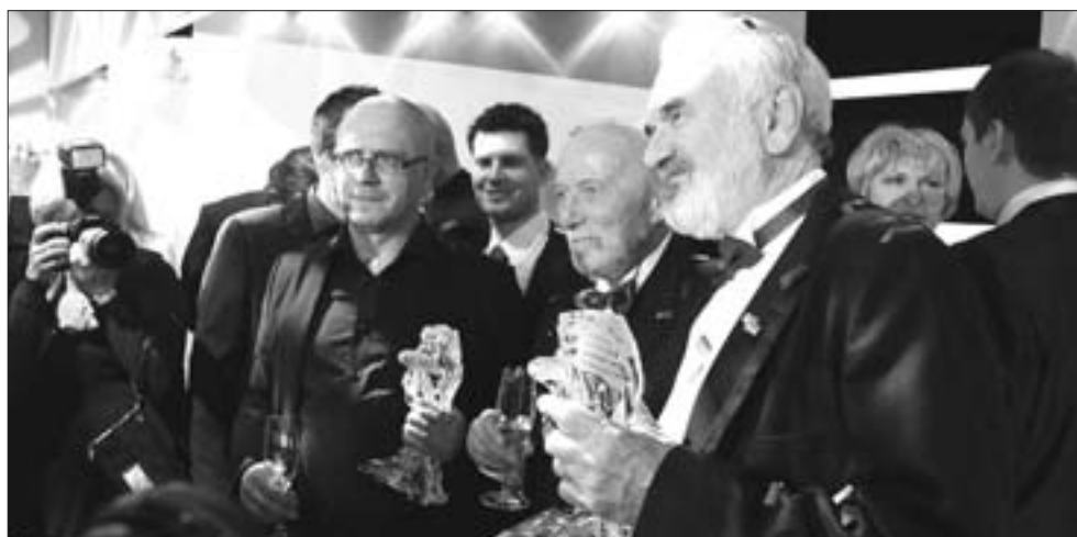
Někteří ocenění po slavnostním ceremoniálu