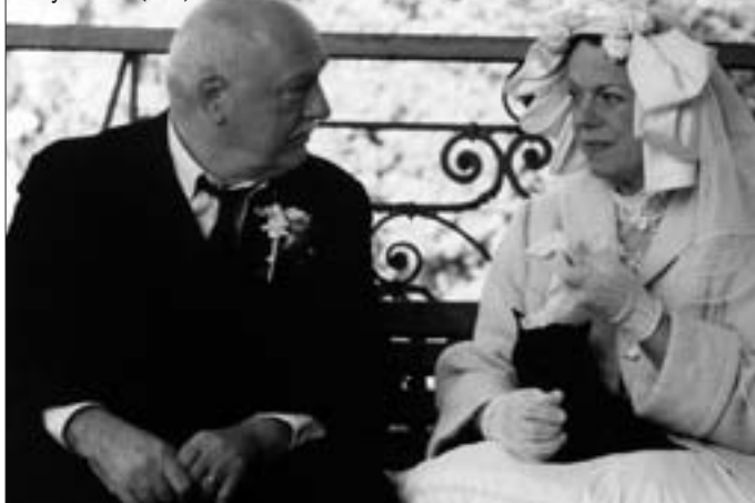
Iva Janžurová ve filmu Romana Vávry Co chytneš v žitě (1998)

výsledek našeho snažení byl ten, že šel s pětiletou vnučkou do krámu. Nikomu z nás se ho předtím na takovou cestu nepodařilo dostat; on si dal raneček na záda a šel si nakoupit!