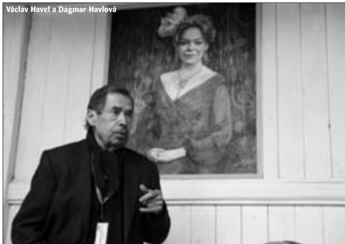
Václav Havel a Dagmar Havlová

Především je Odcházení intelektuální záležitost, která předpokládá poučeního a vzdělaného diváka. Byť se jedná o komedii (tedy spíše grotesku) rozhodně to není dílo vhodné pro široké spektrum divácké obce. Jedná se o solitérní kousek, který v dnešní době totální intelektuální devalvace většinové společnosti mohl vzniknout jen díky osobnosti a vlivu svého tvůrce. Dnes už opravdu nejsme zvyklí na to, že je nám