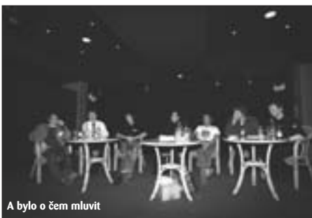
A bylo o čem mluvit

Další téma, nazvané Restrukturalizace pro a proti , se mělo stát fórem pro vrcholový management, kde by vysvětlil důvody, které jej k restrukturalizaci vedly. Jaké výhody přináší nový systém proti minulé struktuře? Jak jej lze srovnat s minulými systémy a s jinými