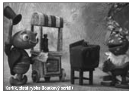
Karlík, zlatá rybka (loutkový seriál)