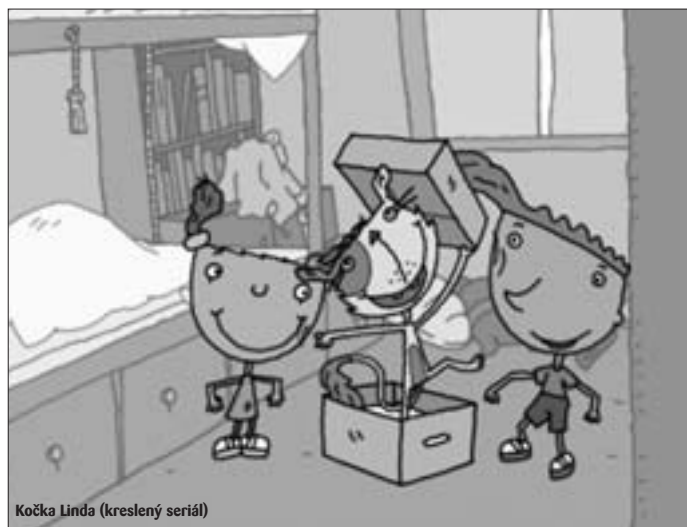
Kočka Linda (kreslený seriál)