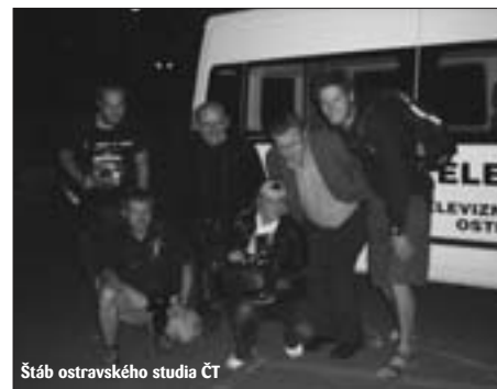
Štáb ostravského studia ČT

redaktor-dramaturg ČT Ostrava, autorka magazínu Babylon