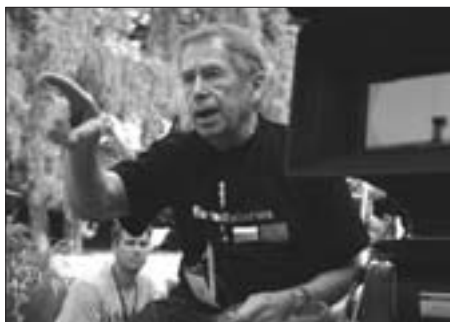
Václav Havel – režisér