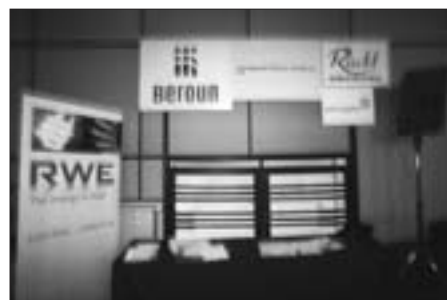
Bez sponzorů by to nešlo

Ještě jednou se v tomto čísle ohlédneme za 29. lednem, dnem, který byl v Berouně spojen s cenami FITESu Trilobit. Trilobit a jeho berounský program jsou vlajkovými loděmi činnosti FITESu, proto nás těší příznivé ohlasy jak na Dopoledne s Večerničky, tak i na slavnostní večer s vyhlášením vítězů a projekcemi, které stále docházejí. Všechny zmíněné akce proběhly v kině Mír.