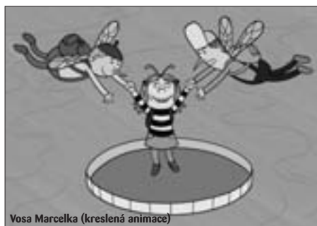
Vosa Marcelka (kreslená animace)